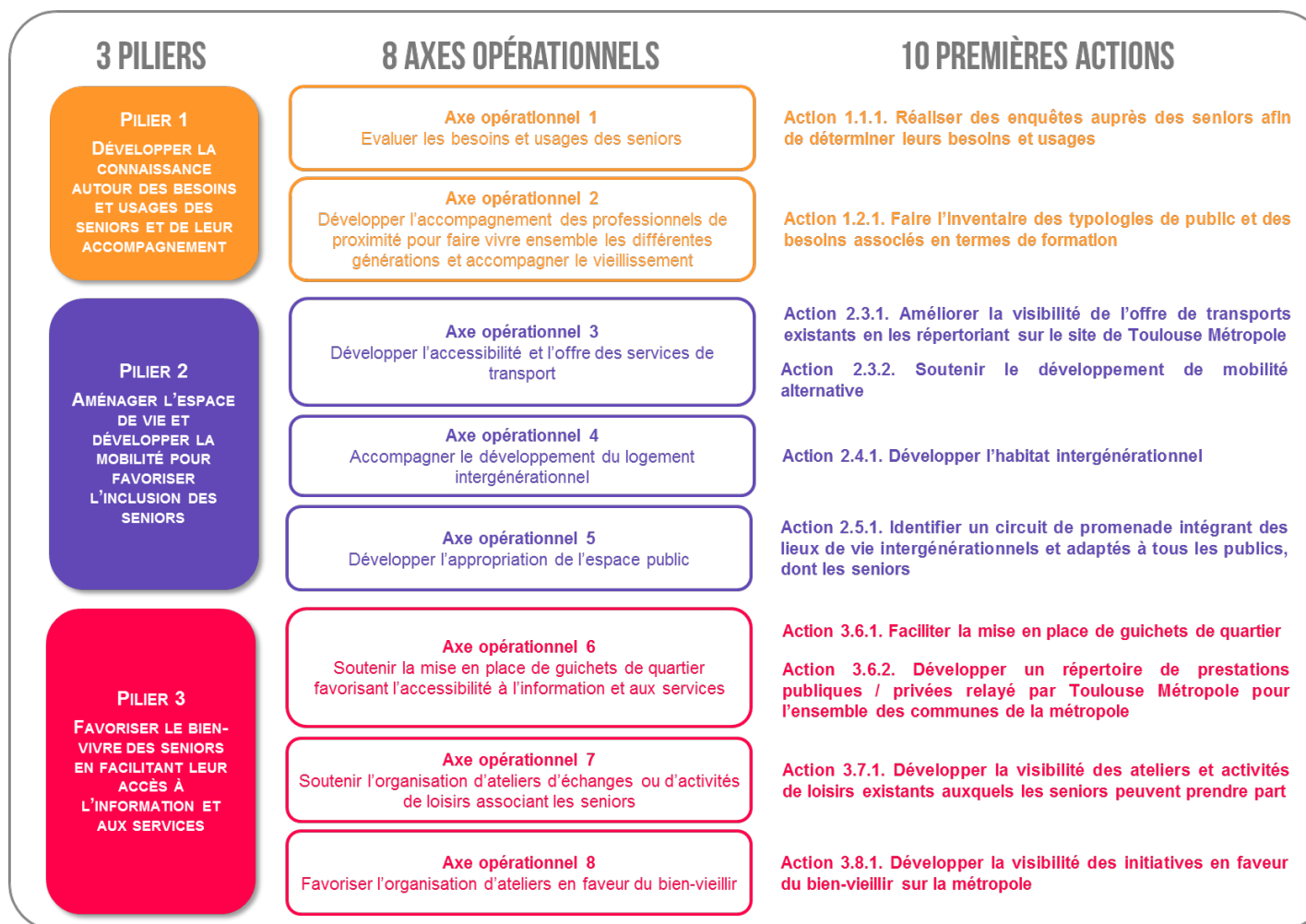
Figure 1 : Piliers, axes opérationnels et premières actions du plan d'action métropolitain